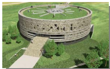
Le Musée archéologique