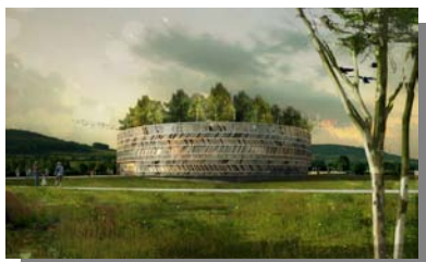
Le Centre d'interprétation

La gestion du site gallo-romain et du futur MuséoParc a été déléguée en 2007 à une société d'économie mixte (la SEM Alésia) dont le Conseil général de la Côte-d'Or est l'actionnaire majoritaire.